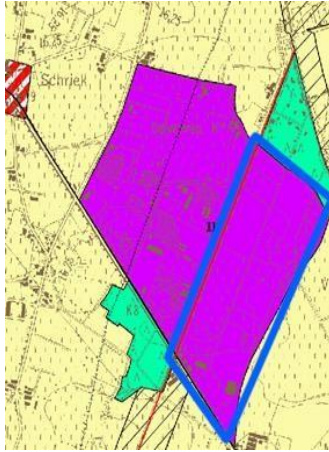
De 26ha aan ongebruikte industriegrond in blauw omlijnd.