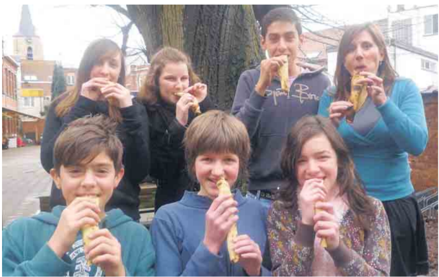
MORTSEL PANNENKOEKEN VOOR HAÏTI De leerlingenraad van het Anna-Theresia-Instituut nam het initiatief om de opbrengst van de jaarlijkse pannenkoekenslag over te maken aan de hulpverlening voor de slachtoffers van de aardbeving in Haïti. De leerlingen hebben het zelf niet altijd breed, maar verzamelden toch 100 euro voor het goede doel. (NNH)©nnh